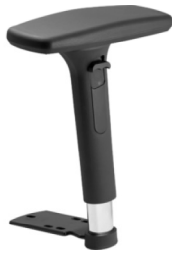
Réf. 1679 Paire d'accoudoirs réglables 3D