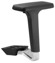
Réf. 1680 Paire d'accoudoirs réglables 4D