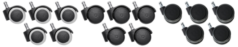
Réf. 10208 Jeu de 5 roulettes sol dur