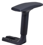
Réf. 1276 Paire d'accoudoirs réglables 2D