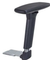
Réf. 1679 Paire d'accoudoirs réglables 3D