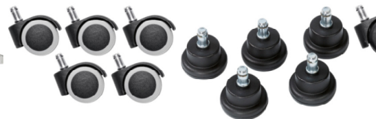
Réf. 10208 Jeu de 5 roulettes sol dur