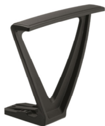
Réf. 1390 Paire d'accoudoirs fixes